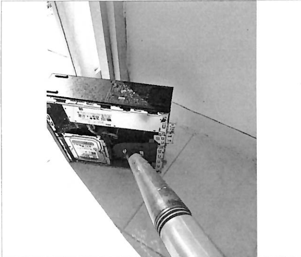
Limpeza con aspiradora de CPUS de las cabinas de transmisión y producción