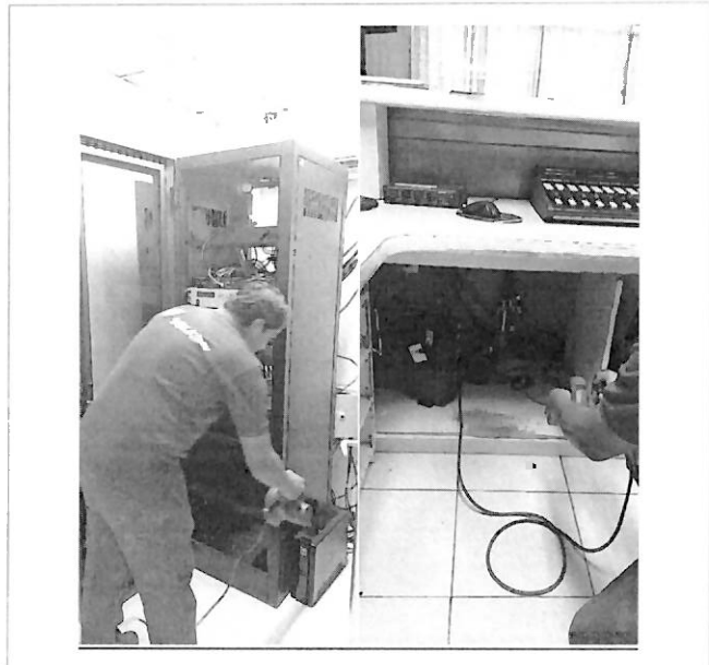
Extracción de polvo de UPS's instalados en el cuarto de transmisión, y la cabina de transmisión, para evitar daños en los ventiladores de enfriamiento